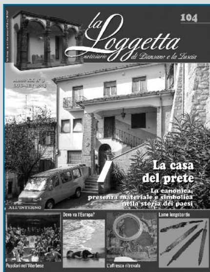
La Loggetta n. 104 (luglio-settembre 2015) La casa del prete