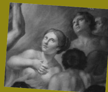
Chiesa di S. Felice